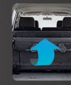
Lipatan bangku ke 3