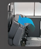
Lipatan bangku ke 2